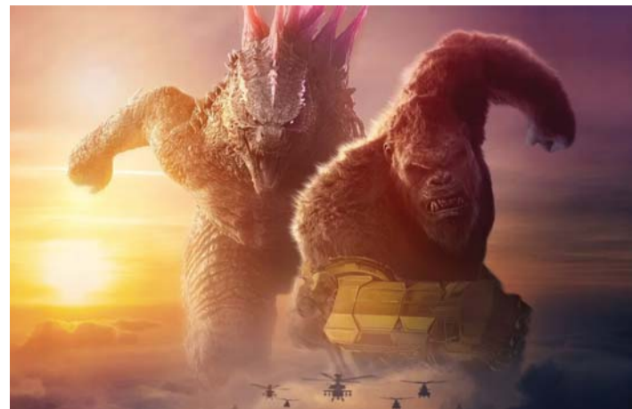
Märulit ja vägevaid kaklustseene näeb filmis palju.

Kui te mingil põhjusel ei ole varem USA versioonis Godzilla filme näinud, siis infoks: Godzilla filmid kuuluvad koletistemaailma frantsiisarja (MonsterVerse), mis algab