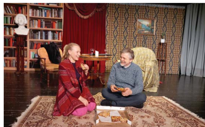
Hetk lavastusest.