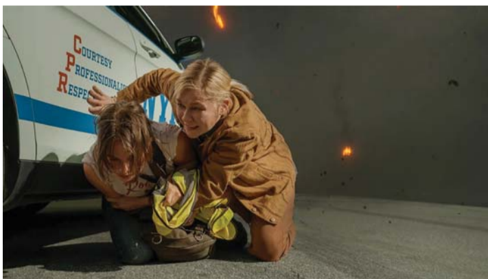
Peategelane Lee ja algaja fotograaf Jessie.

Rindefotograaf Lee (Kirsten Dunst) rändab koos väikese ajakirja-