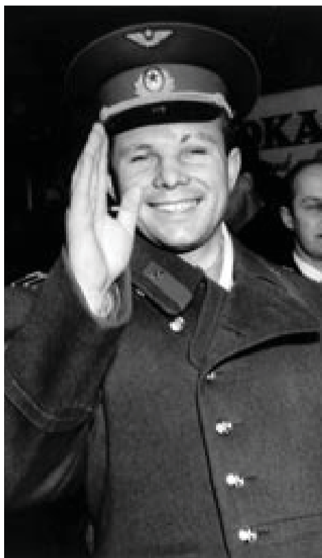
Juri Gagarin Rootsis 1964.

NSV Liidus oli oluline iga inimese taust ja pe-