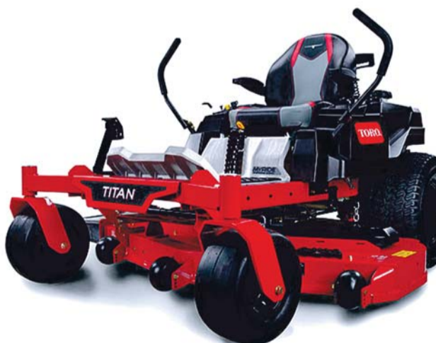
TORO ZXM5475 Titan MyRyde ®