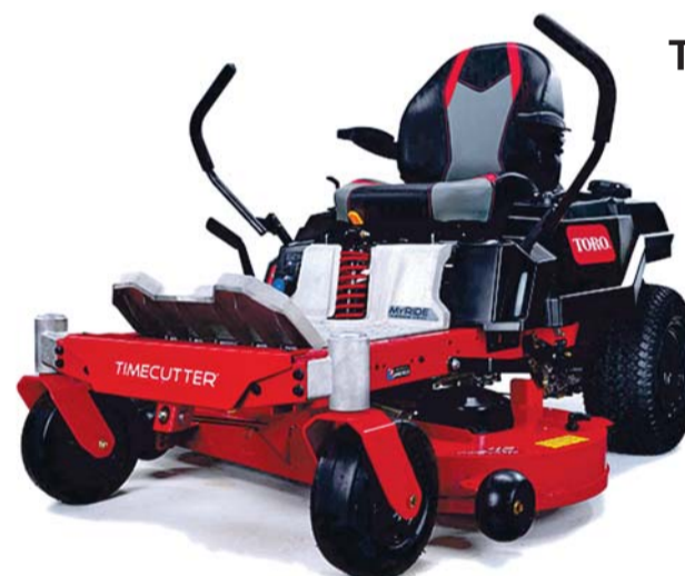
TORO MR4275T Timecutter MyRyde ®