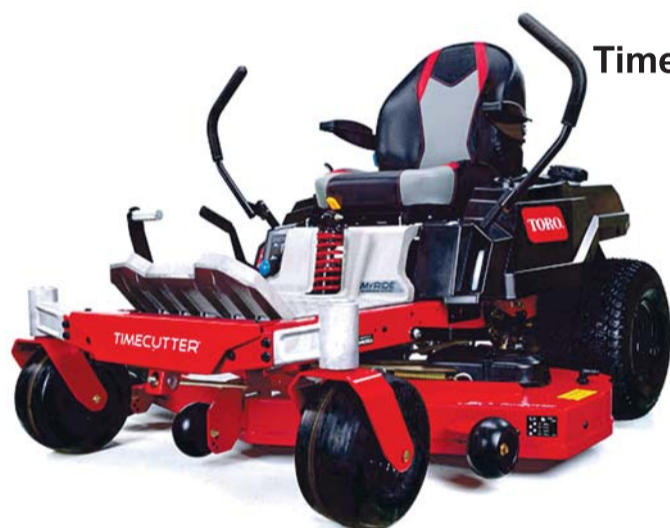
TORO MR5075T Timecutter MyRyde ®

NÜÜD ERIHINNAD! TORO ® KAASA VÄÄRT KINGITUS!