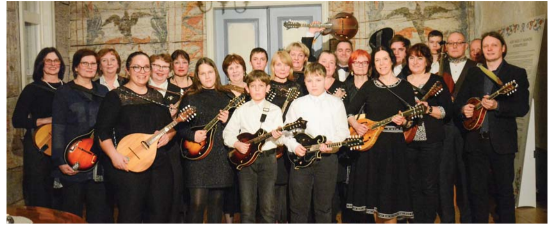
Tapa mandoliiniorkestri puhul on tegu põlvkondade ülese seltskonnaga.