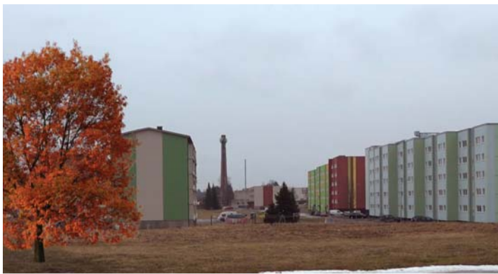
Praegu laiub Kadrina aleviku põhjaküljes Pärnu–Rakvere–Sõmeru maantee ja Kalevipoja tänava esimeste kortermajade vahel tühi väli, mis ei paku sealsetele elanikele silmailu ega kaitset müra ja ilmastikutingimuste eest.

Ta lisas, et selliseid edukaid kampaaniaid on Hooandjas olnud varemgi, kuid see pole tavaline. „See näitab, et Kadrina kogukond on kokkuhoidev ja tugev ning suudab vajadusel kiiresti tegutseda. Nii kiire eesmärgini jõudmine on ka märk