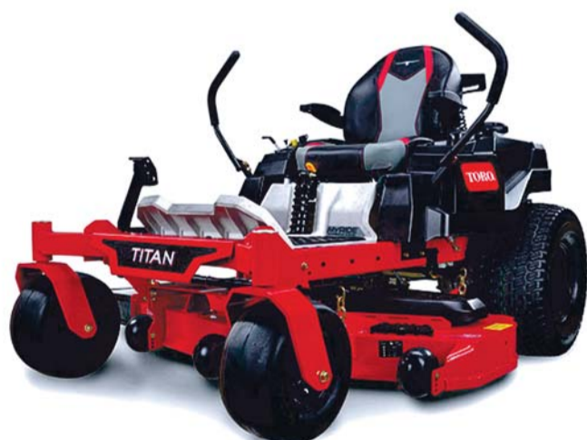
TORO ZXM4875 Titan MyRyde ®