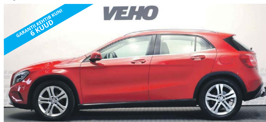
Mercedes-Benz GLA 220 d 4MATIC 2.1 R4 130kW Aasta: 2016 Läbisõit: 105 000 km Käigukast: automaat Kütus: diisel