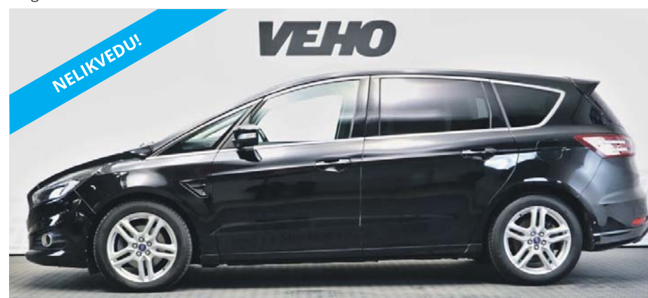
Ford S-MAX Titanium AWD 2.0 TDCi 132kW Aasta: 2016 Läbisõit: 137 000 km Käigukast: automaat Kütus: diisel