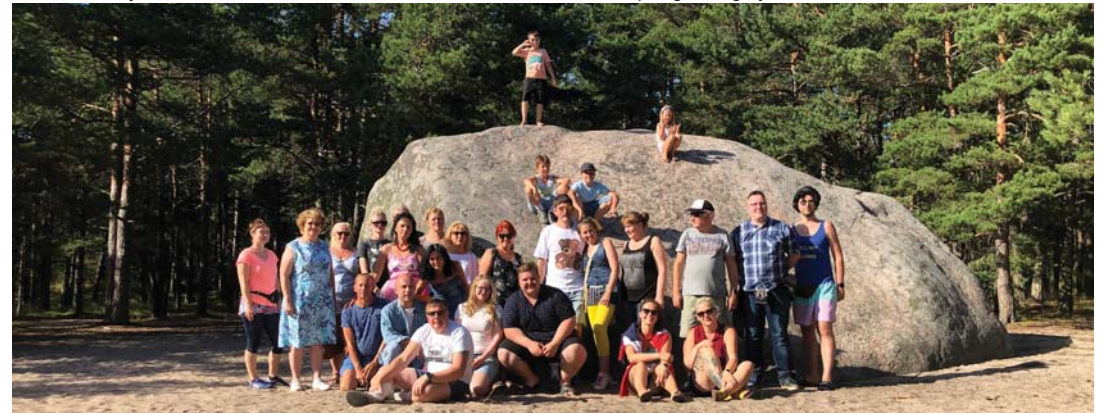
Töötajate suvepäevad 2021 Prangli saarel.

hetkel muudeti bränd võrkeelseks ITshopiks, kuna oli plaan minna äriks ka üle piiri. „Aga see jäi 2008-2009 kriisiaga, mis tõmbas plaanidele kriipsu,“ nentis Priidu Trutsi.