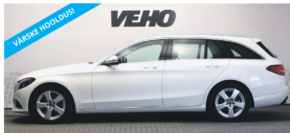
Mercedes-Benz C 220 d Avantgarde 2.2 125kW Aasta: 2017 Läbisõit: 140 200 km Käigukast: automaat Kütus: diisel