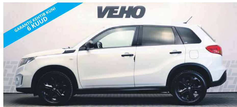
Suzuki Vitara GL 1.6 88kW Aasta: 2016 Läbisõit: 194 500 km Käigukast: manuaal Kütus: bensiin

Usaldusväärsetelt Veho AS Ülemiste esindusest.