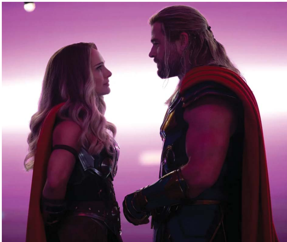
Natalie Portman Thori ekspruudi Jane Fosteri rollis ja Thor Odinson Chris Hemsworthi kehastuses.

Varasemas kolmes filmis on Thori kõrval kurja poolvenda Lokit kehanud Tom Hiddleston, kelle puhul võib samuti öelda, et ta on sellesse rolli justkui valatud. Paraku peavad Hiddlestoni fännid seekord kibedaid pisaraid valama, sest neljandas filmis me teda ei näe, küll aga on tagasi Natalie Portman Thori (eks)pruudi Jane Fosteri rollis. Veelgi enam – eelmises osas lõhutud Thori haamer arvab nüüd, et Jane on tema jaoks see õige peremees ja seega on Jane nüüd superkangelane. Etteruttavalt ütlen siiski niipalju, et Thor