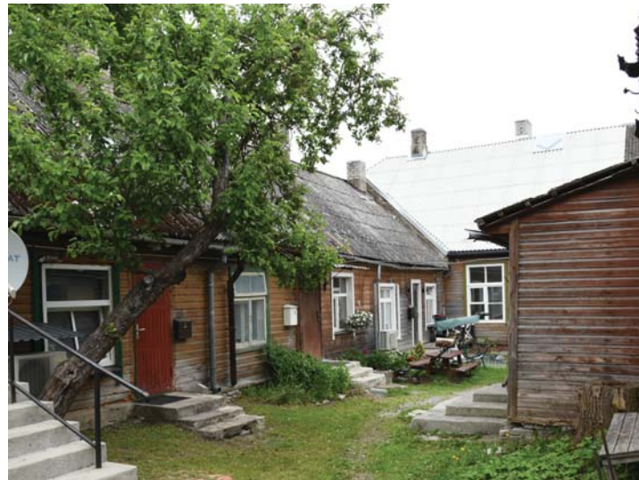
Hubane sisehoov Rakvere muinsuskaitsealal, näha on 18. sajandi teisest poolsest pärit tänavaäärsele hoonele 19. sajandil tehtud juurdeehitused.

Pikk 29 ehk maja, kus omal ajal elas ja töötas Juhan Kunder ning pikka aega tegutses ka Juhan Kunderi selts, on praegu üsna õnnetus seisus. „Kunderi seltsi maja on nõukogude ajal väga ära rikutud. Omal ajal oli sel ilus pilkupüüdev puitpits. Nüüd tuleks tagasi teha koopia. Aga kuidas me väärtustame koopiat? Koopiahoonel ei ole ajaloo mõistes suurt väärtust, küll aga tänava ja miljöö jaoks,“ arutles Lääne-Viru-