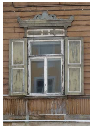
Pitsiga aken. Hoone on 19. sajandi viimasest kümnendist.

Kaitsekorruga jaotatakse Rakvere vanalinna hooned nelja kaitsekate-