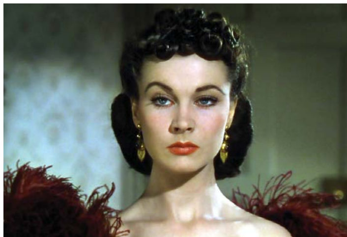
Vivien Leigh naispeaosatäitja Scarlett O'Harana filmist „Tuulest viidud“. Kaader filmist

1935. aastal saabus esimene suurem edu. 22aastaselt sai ta seksitöötaja Henriette rolli skandaalses lavastuses „Vooruse mask“. Tema mängimine võeti vastu suurte ovatsioonide ja kriitikute tunnustusega ning sellest näidendist sai alguse Leigh' tormiline tõus Hollywoodi tippstaa-