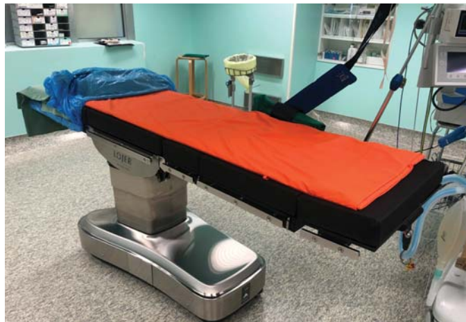
Uued operatsioonilaudad võimaldavad arstidel mugavamalt opereerida ka kaalu poolest raskemaid patsiente, sest hüdraulika võimaldab lauda seadistada ka 250+ kg kaaluva patsiendi puhul.

Uute laudadega on Suurkaevu sõnul operatsioonimeeskonnad väga rahul, sest need võimaldavad mugavalt ka kaalukamaid patsiente opereerida. „Eelmiste opilaudade hüdraulika seda ei võimaldanud. Operatsioonile sattuvate inimeste seas on paraku järjest rohkem kaalu poolest raskemaid patsiente,“ tõdes Ain Suurkaev. „Ülesõõnud inimene on haigustele vastuvõtlikum, teda saadavad keerulisemad asjad. Liigne kehakaal paraku võimendab ja so-