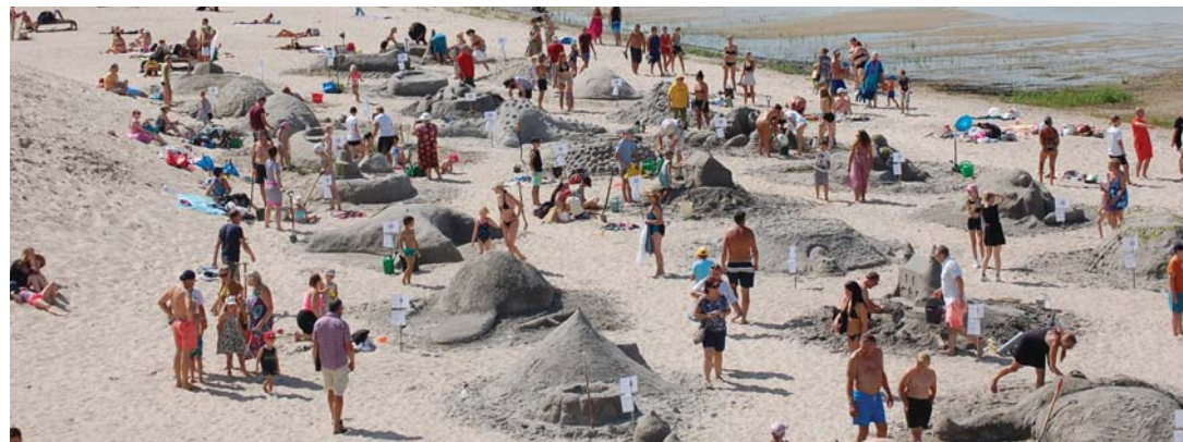
Juba alates aastast 2000 on Võsu randa kutsutud juuli teisel nädalavahetusel liivaskulptuure ehitama, nii ka tänavu.