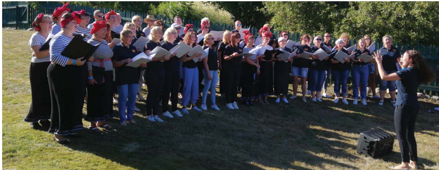
Viimasel Viru Folgil astus Narva eesti keele maja tandemkoor üles koos Paldiski kooriga – triibulistest särkides on Paldiski lauljad, tumedates narvakad.