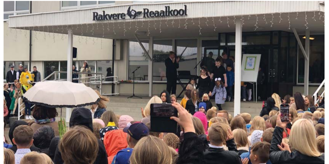
Ukraina sõjapõgenike esimese ja teise klassi lapsed alustasid kooliteed Rakvere Reaalkoolis.