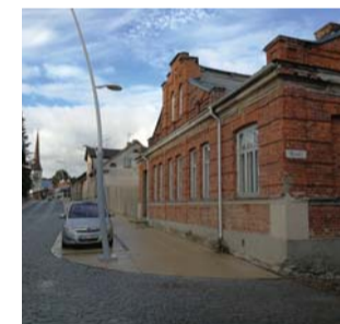
Rakvere adventkoguduse hoone Pikal tänaval. Ajalooliselt ehitati see aastal 1898 tütarlaste erakoolimajaks, mille 1936 ostis kogudus ja ehitas ümber kirikuks.