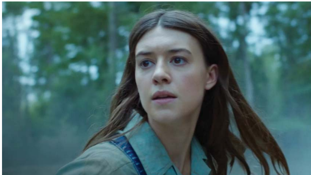
Peategelane Kya Clark (Daisy Edgar-Jones).

Eesti keeles ilmus romaani esmakordselt 2019. aastal, kordustrükk 2022. Tõlge ilmus päris kiiresti, sest inglise keeles ilmus raamat 2018. aastal. Tegemist on täieliku hitiga, rahvusvahelise bestselleriga, mida ümbritseb ka mõningane saladuse-