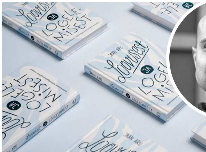
Raamatu foto on disainibüroolt Ruum 414 – kujundus pälvis reklaamiauhinna Pronksmuuna.