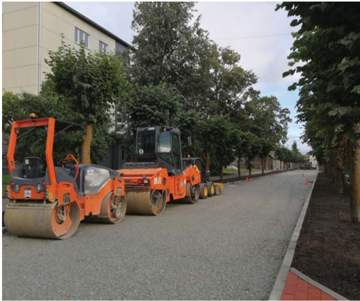
Pikalt halvas seisus olnud Küti tänav Rakveres on saamas lähapäevil korda. Liiklejatel tuleb aga arvestada, et see muutub ühesuunaliseks – sõita saab Tallinna tänavalt Jaama tänavale.

aeg on abilinnapea sõnul septembri keskpaik, kuid asfalteerimistöödega jõutakse valmis varem ja tänav saab ka varem sõidetavaks, vana on paigaldada veel liiklusmärgid ja teha pisitöid.