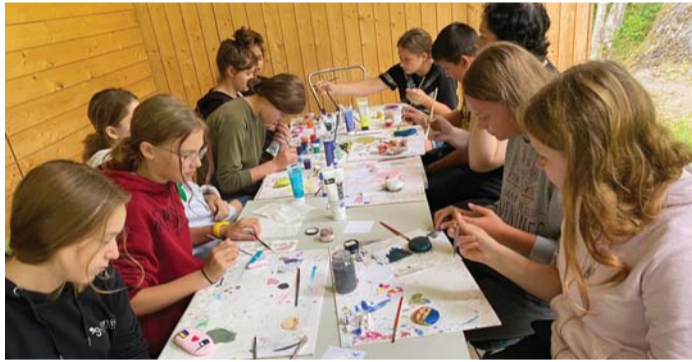
Kadrina valla eestlased ja ukrainlased õppeaasta eel laagris – mitmesugused ühistegemised liitsid neid kokku.