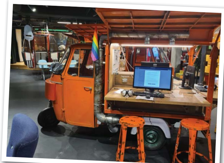
Noorteraamatukogu Deichman Biblio Tøyen – arvutiturk.