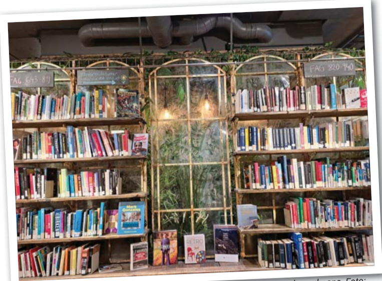
Deichman Stovner – raamatukogu kaubanduskeskuses, mis on nagu kasvuhoone.