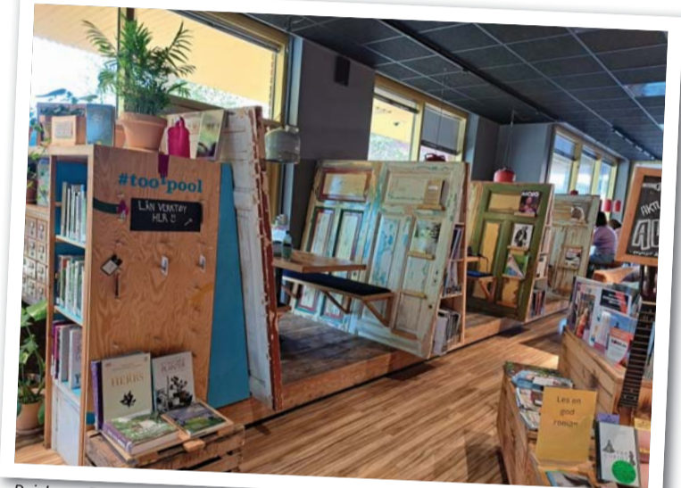
Deichman Tøyen - uste taaskasutus.