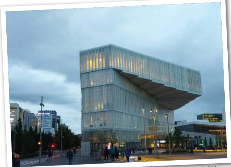
Eelmise aasta maailma parim rahvaraamatukogu Deichmani Bjørvika – paremale jääb ooperimaja. Raamatukogu omapärane kuju on tingitud sellest, et ta ei tohtinud varjata vaadet ooperimajale.