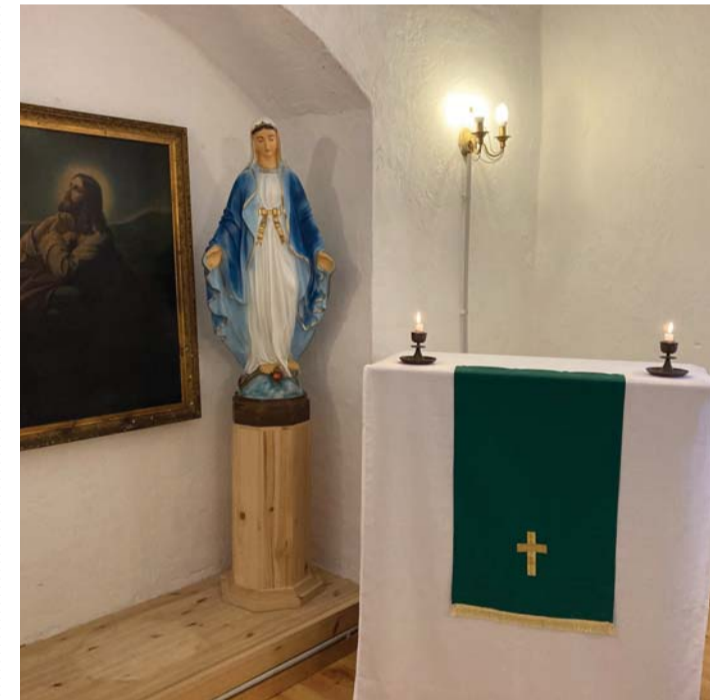
Maarja kuju Viru-Nigula talvekirikus on Eesti katoliiklaste toodud ja seda kasutatakse iga-aastastel suvistel palverännakutel Viru-Nigula Maarja kabelisse. Maal on 19. sajandi Overbecki „Jeesus Ketsemani aias“ koopia.