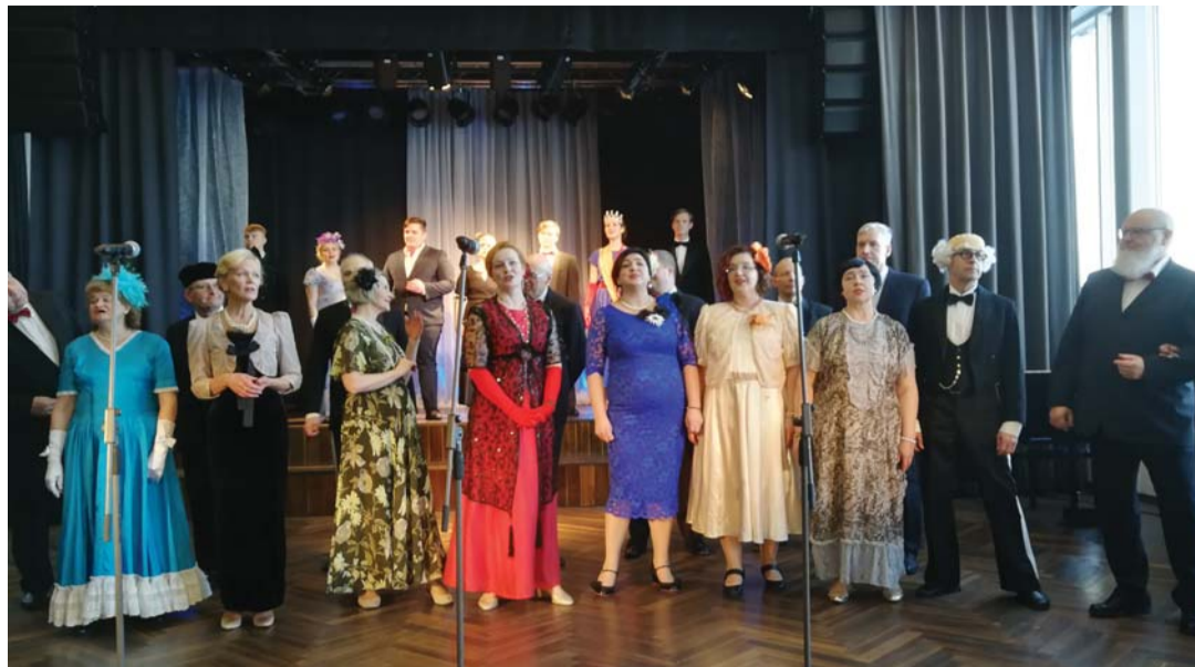
Hiljuti esines Lehtse kammerkoor kontsertkavaga operetist „Ainult unistus“ Sõmerul Lääne-Virumaa aasta tegude väljakuulutamisel.

Küsimuste korral on võimalik tellida endale päästjate poolt koodunõustamine helistades riigiinfo-telefonile 1247.