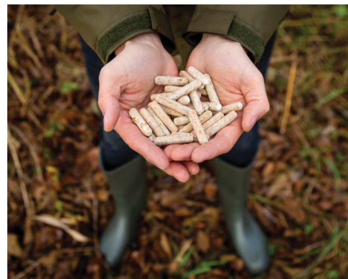
Musta pässikut kandvad tüüblid valmistatakse Eestist pärit seenepaljudamisel Belgia seenelaboris. Et seen kasetüvel kasvama hakkaks, puuritakse puusse auk ning pistetakse sinna tüübel. Kuue-kaheksa aastaga peaks kasvama seen korjevõlmiks.