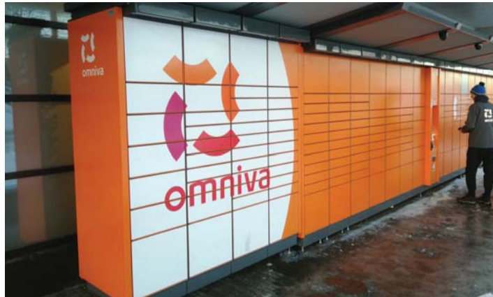
Linnades on pakiautomaadid väga mugav viis pakki saatmiseks ja vastuvõtmiseks. Väiksema rahvaarvuga piirkonna elanikel tuleb praegu tellida oma pakk automaati, mis jääb kilomeetrite kaugusele, tulevikus võib olla lahenduseks, et kuller viib pakki koju või grupikasti.