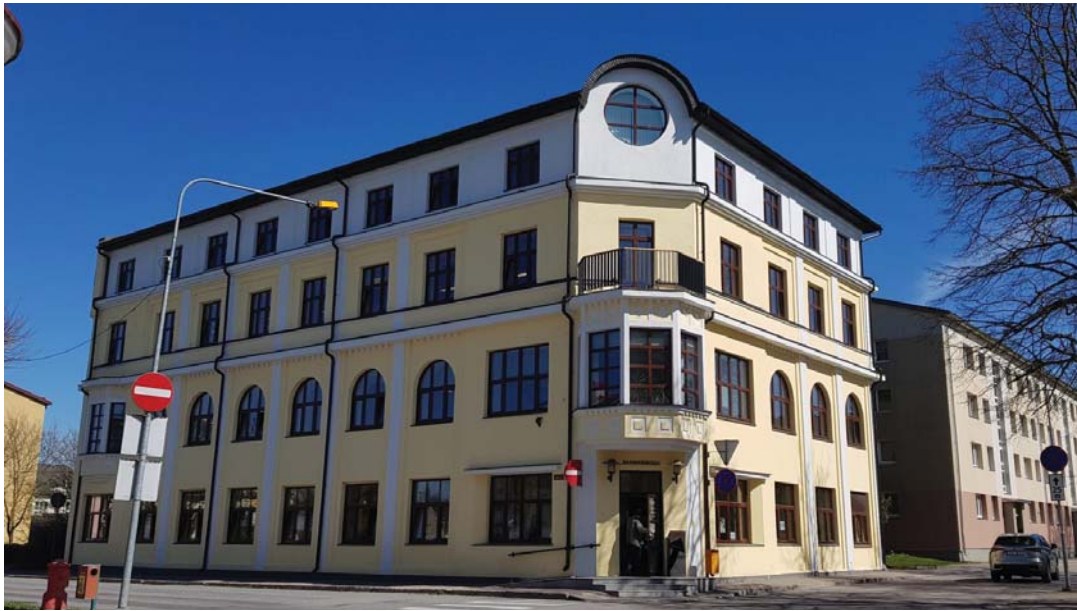
Lääne-Virumaa Keskraamatukogu pakub lõimumisega seotud tegevusi ka praegu, nüüd on võimalus neid arendada.

Rakvere linna Triin Varek rääkis, et eelistatud on piirkonnad, kes ka varasemalt osalesid – peale