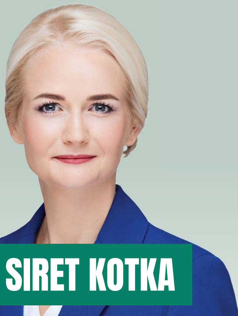
972 SIRET KOTKA