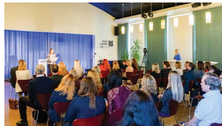
E-väljaannete laenutuse avamine.

„Selle aasta sõbrapäev on ka kirjanduse pidupäev. Laiendamine võimalusi lugemiseks ja kaotasime piire. E-väljaannete laenutuse teosega saab minna välismaale ja teoseid ei saa mitte ainult lugeda, vaid ka kuulata – valida võib paarisaja audioraamatu hulgast. Mis mulle tõeliselt heameelt valmistab on see, et lugemine ei pea enam öökappi ootama. E-raamat või audioraamat on alati kaasas ja lugemiseks saab teine-