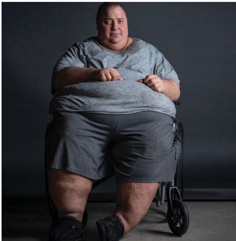
Brendan Fraser pidi Charlie rolli tehes kandma 136 kg kaaluvat kehaproteesi.

Filmi peategelast Charliet (Brendan Fraser) on end paksuks sööma tõuganud elukaaslase surm. Mees on homoseksuaalne, tema poiss-sõber oli aga ka usklik ning kui usupere ta endi seast ära tõukas, siis sooritas mees enesetapu, olles eelnevalt olnud pikalt depressiivne. Neid sündmusi ekraanil ei näidata, üksnes mainitakse muu dialoogi sees. Kogu filmi tegevustik toimub Charlie kitsukeses majas, peamiselt ühes kööktoas, kus Charlie veedab