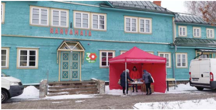
Raamatute kogumine Kadrinas.

Veebruari kolmandal nädalal kodudest Kadrina rahvamajja toodud kirjandusest pääses kohe uuele ringile umbes veerand raamatutest. „Eesti inimesed on raamatu usku. Nad eelistavad anda oma raamatud