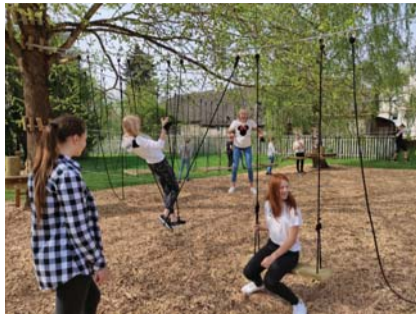
Rakvere põhikooli õuel olev madalseiklusrada.

P ühapäeva õhtul lõppenud Rakvere linna tänavuse kaasava eelarve rahvahääletuse võitis idee „Palermosse/linna metsa madalseiklusraja ehitamine“, mis sai 127 häälet.